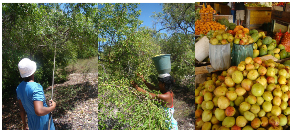
Figura 13.1 – Catadoras de mangaba praticando o extrativismo e frutos de mangabeira comercializados em barracas de frutas no mercado municipal, em Sergipe.

A coleta dos frutos da mangaba pode ser melhor compreendida na Figura 13.1, a seguir, que traz catadoras de mangaba e frutos colhidos.