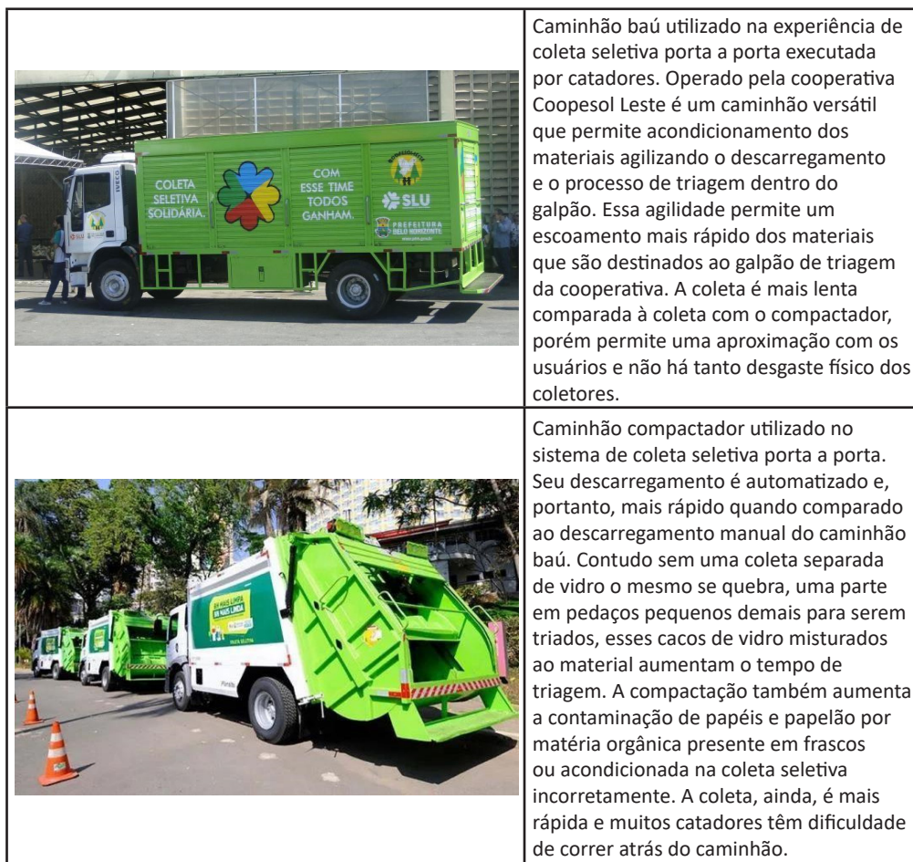
Quadro 10.1 – Modais de Transporte de coleta seletiva de resíduos porta a porta

zados após a contratação das cooperativas, pois foram os equipamentos de transporte disponibilizados pela SLU de sua frota própria (Quadro 10.1).