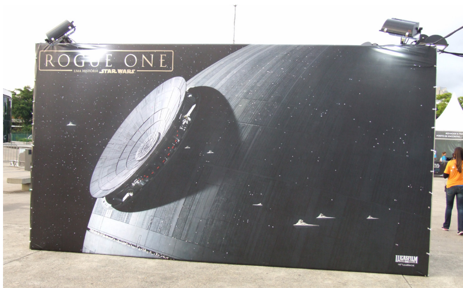
Figura A.3 – Painel de interação com destaque para a Estrela da Morte na Star Wars Run 2016.