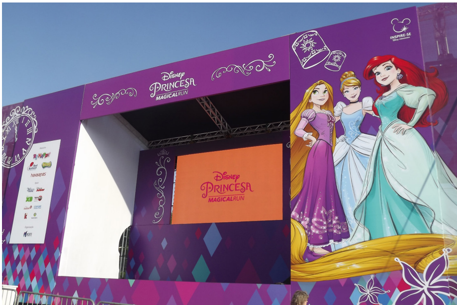
Figura B.11 – Palco principal para premiação e shows da Princess Magical Run 2017.