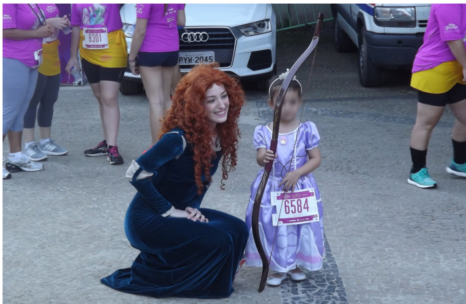
Figura B.5 – Atriz trajada e produzida como a princesa Merida interage com o público na Princess Magical Run 2017.