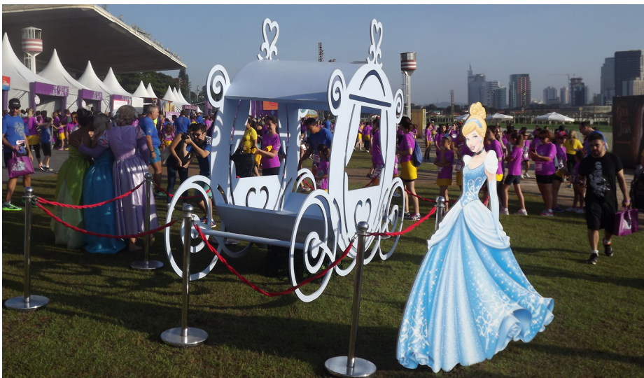
Figura B.2 – Ambiente ao ar livre com carruagem acompanhado de totem em tamanho real da princesa Cinderela na Princess Magical Run 2017.