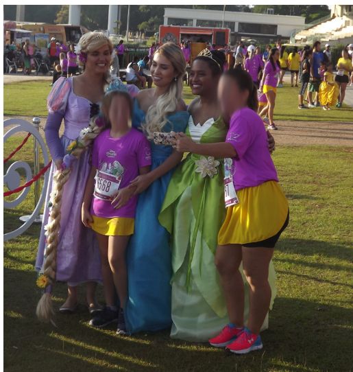
Figura B.4 – Atrizes trajadas e produzidas como princesas Disney interagem com o público na Princess Magical Run 2017.