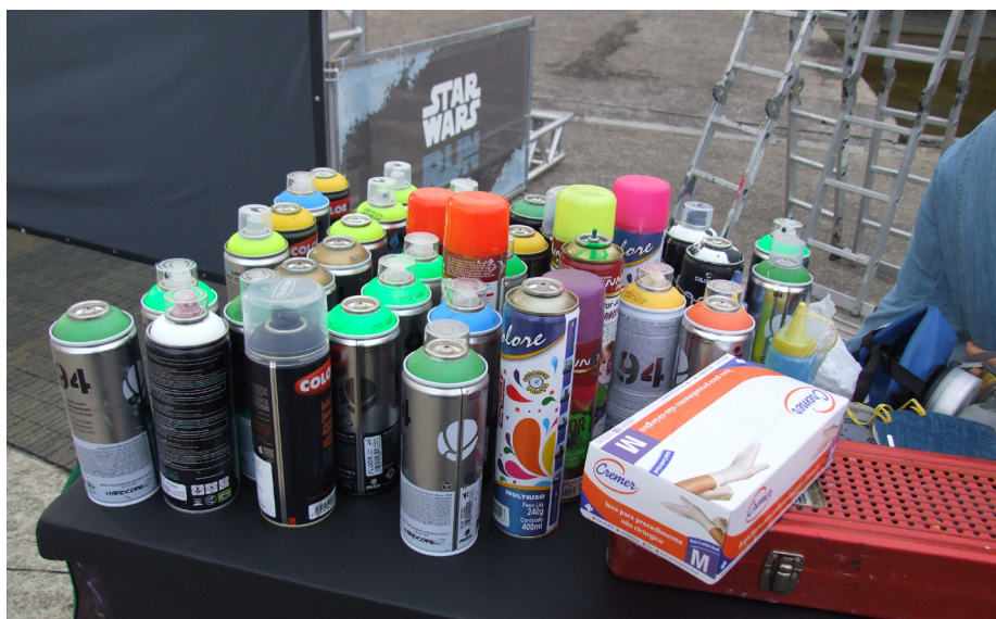
Figura A.8 – Materiais utilizados pela artista plástica Simone Siss para a produção do painel da Star Wars Run 2016.