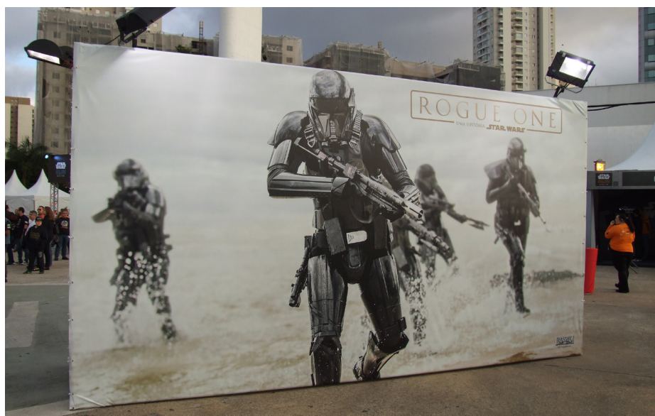
Figura A.4 – Painel de interação com destaque para os personagens Black Stormtroopers na Star Wars Run 2016.