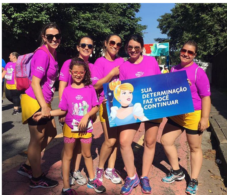
Figura B.13 – Participantes posam com placa motivacional na Princess Magical Run 2017.