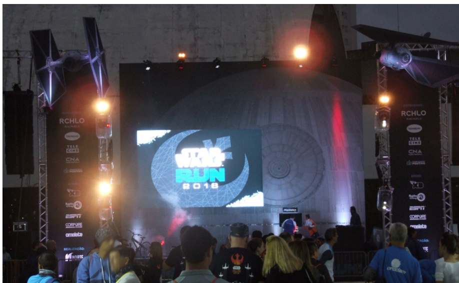
Figura A.10 – Iluminação do palco principal na arena da Star Wars Run 2016.