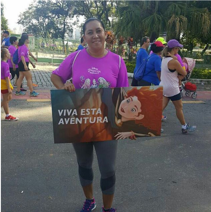
Figura B.14 – Participante posa com placa motivacional na Princess Magical Run 2017.