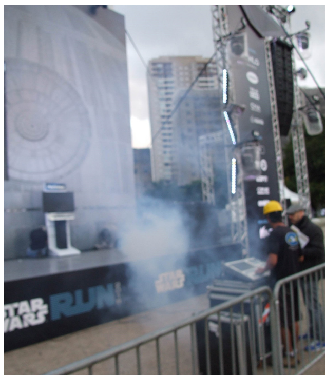
Figura A.6 – Detalhe do palco soltando fumaça na Star Wars Run 2016.