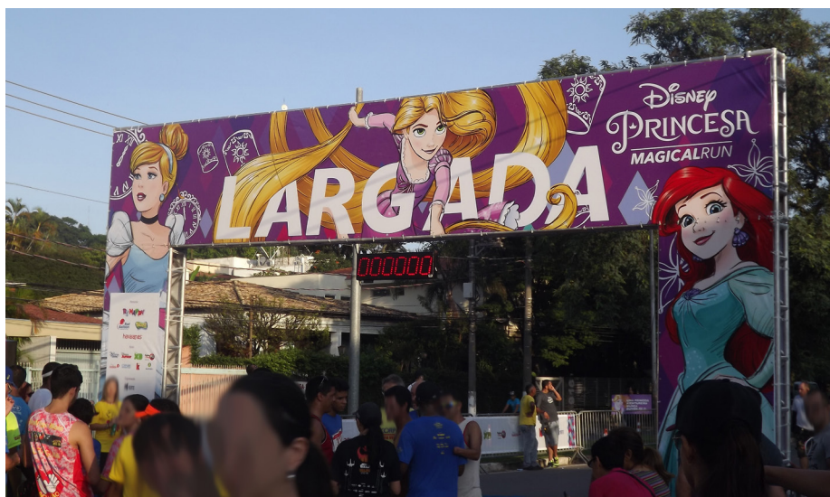
Figura B.12 – Pórtico de largada da Princess Magical Run 2017.