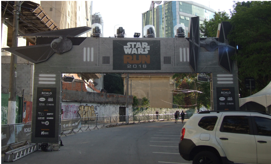
Figura A.1 – Pórtico de largada da Star Wars Run 2016.