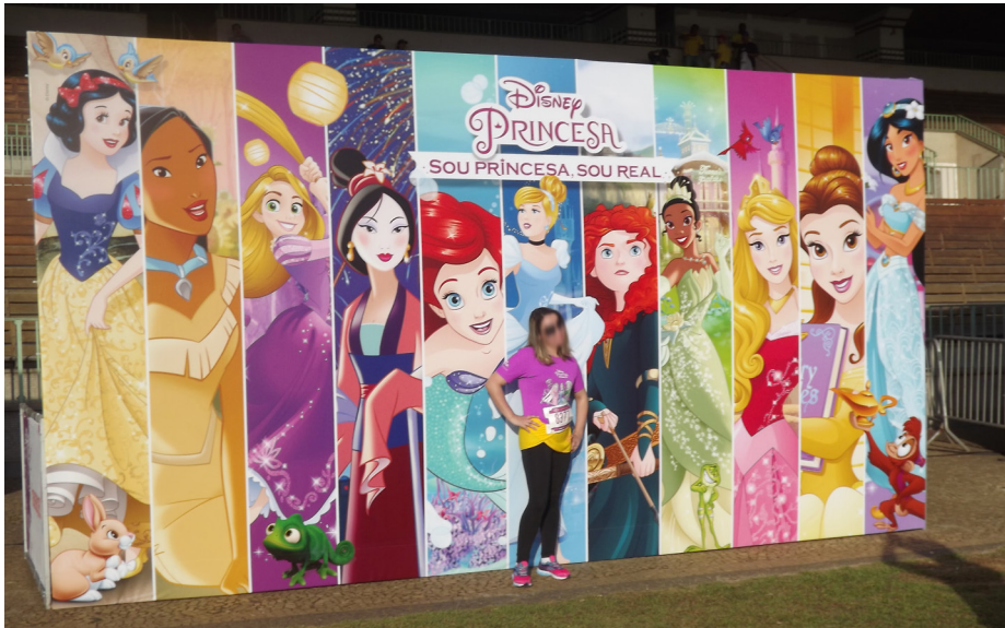
Figura B.1 – Painel com as princesas da franquia Disney Princesa® na Princess Magical Run 2017.