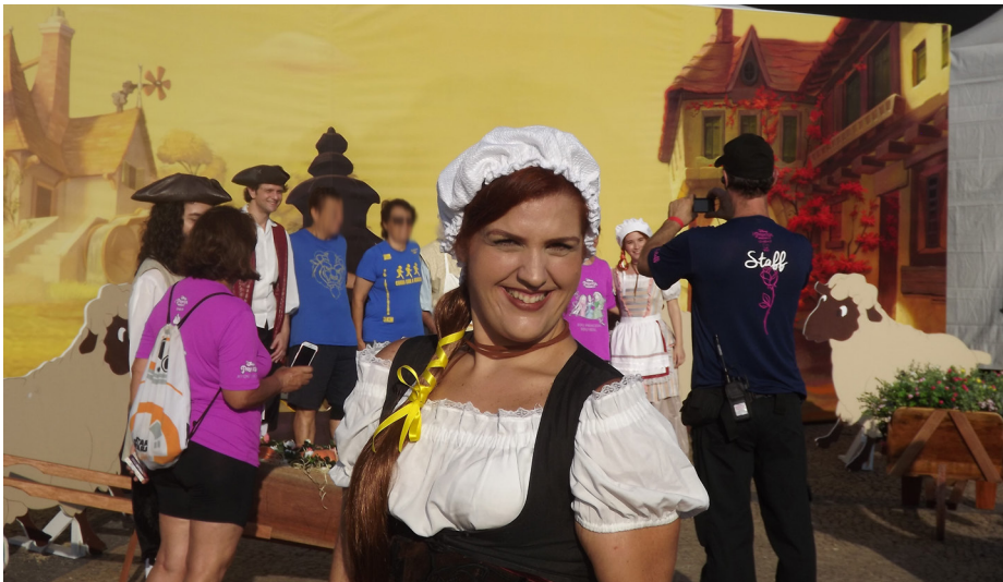
Figura B.9 – Ambiente ao ar livre construído com totem de fundo com a paisagem da história de A Bela e a Fera , junto com totens de personagens e objetos em escala real, além de atrizes e atores trajados como personagens na Princess Magical Run 2017.