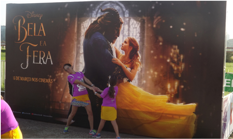
Figura B.10 – Painel de interação com destaque para os personagens do filme A Bela e a Fera na Princess Magical Run 2017.