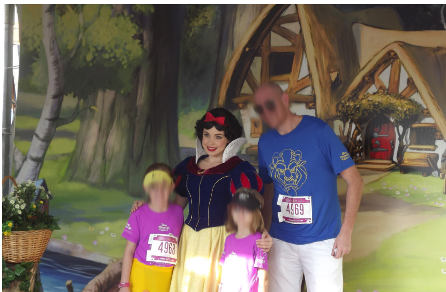
Figura B.7 – Cabine de fotos da Branca de Neve na Princess Magical Run 2017.