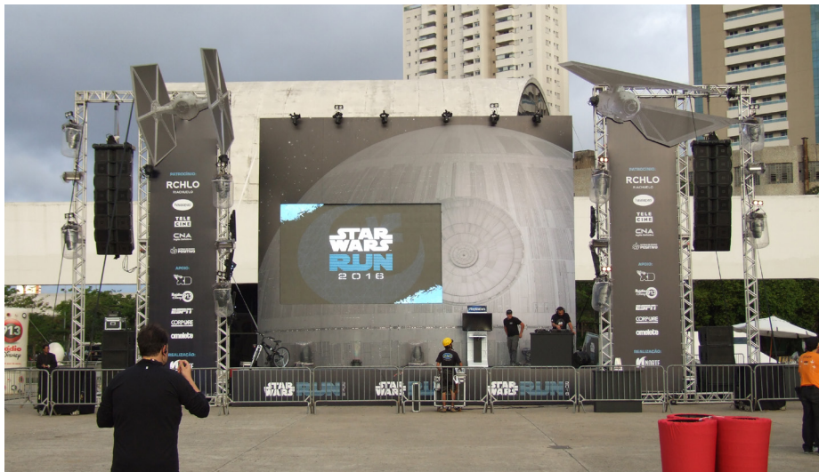
Figura A.2 – Palco central de premiações e shows da Star Wars Run 2016.