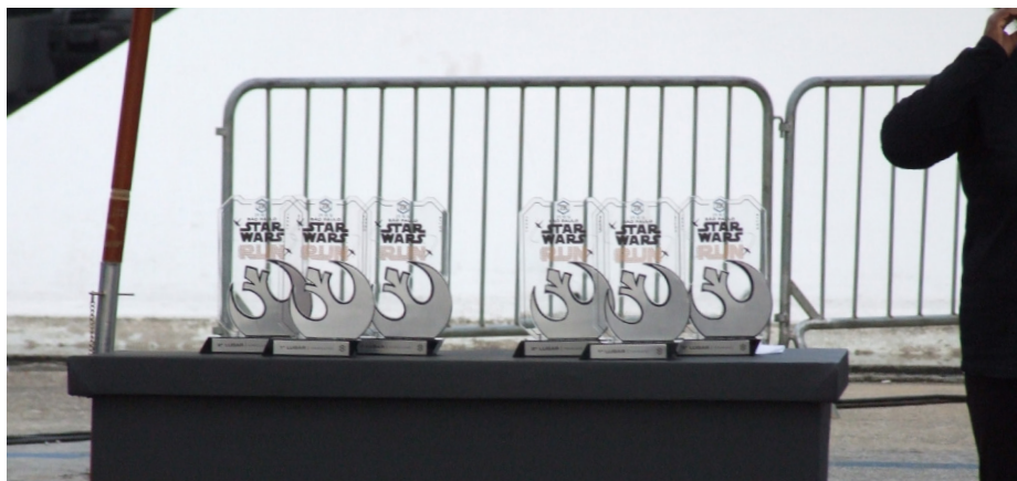
Figura A.5 – Detalhe dos troféus de premiação da Star Wars Run 2016.