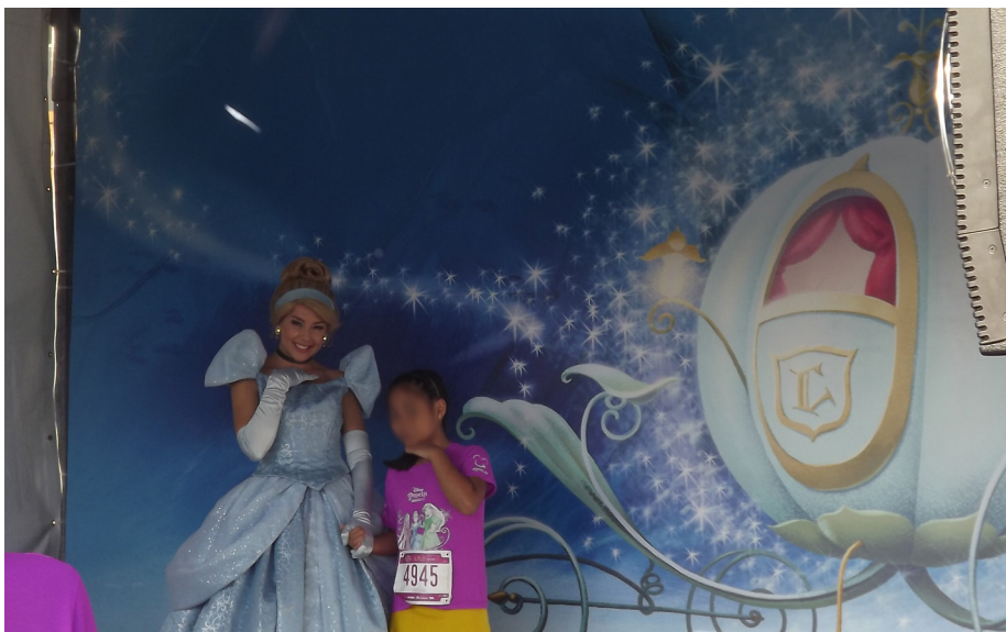
Figura B.6 – Cabine de fotos da Cinderela na Princess Magical Run 2017.