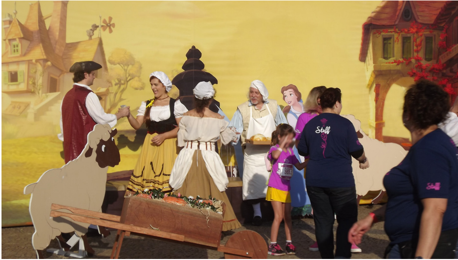
Figura B.8 – Ambiente ao ar livre construído com totem de fundo com a paisagem da história de A Bela e a Fera , junto com totens de personagens e objetos em escala real, além de atrizes e atores trajados como personagens na Princess Magical Run 2017.