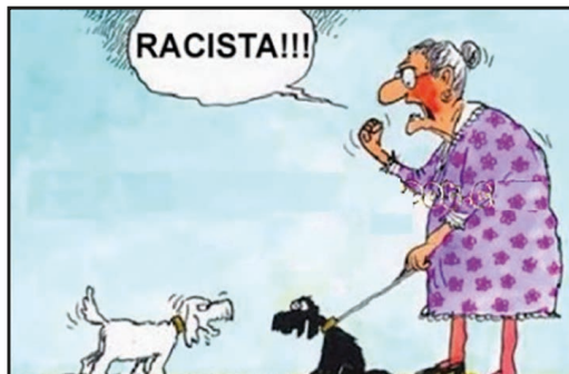
Figura 9: Imagem sobre racismo e controle social