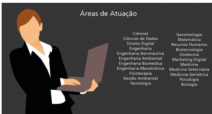
Figura 1 - Áreas de atuação

Para que você possa já iniciar esta mudança ou pelo menos que você comece a pensar nas profissões do futuro, seguem abaixo algumas áreas e profissões que estarão em alta nos próximos anos.