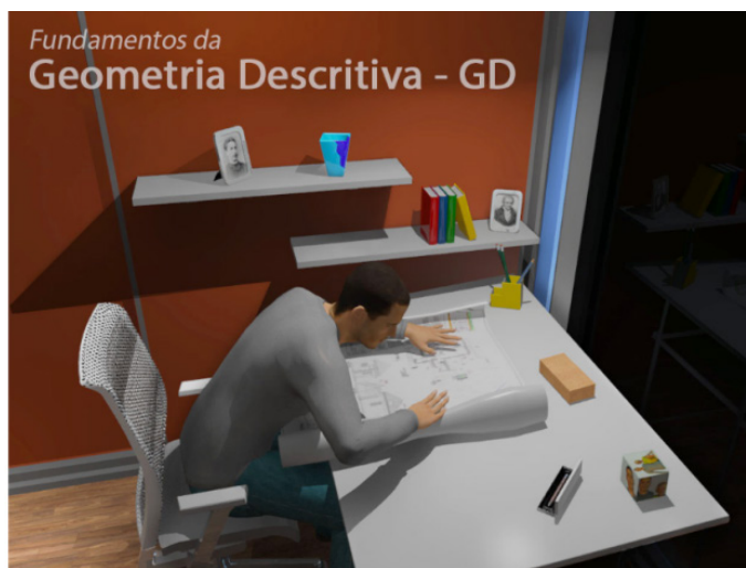
Figura 3: Tela inicial.

Ao entrar no OA, aparece a Tela Inicial – Figura 3 - que serve de conexão para todos os links contidos neste infográfico.