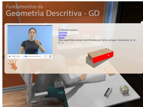
Figura 5: Tela de conteúdo - faces.

objetos podem ser utilizados em outros contextos de aprendizagem. Deste modo, o objeto possui um nível granularidade que permite seu reuso.