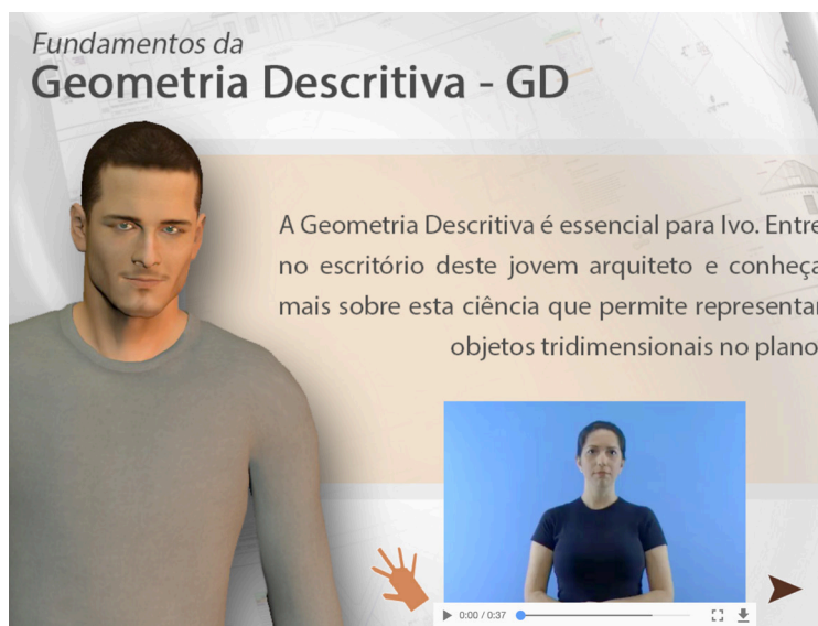
Figura 1: Tela de abertura – opção em LIBRAS.

Trata-se de um material descritivo e explicativo, com potencial para a função narrativa, tendo em vista que um personagem é apresentado logo na tela de abertura, conforme é possível visualizar nas Figuras 1 e 2.