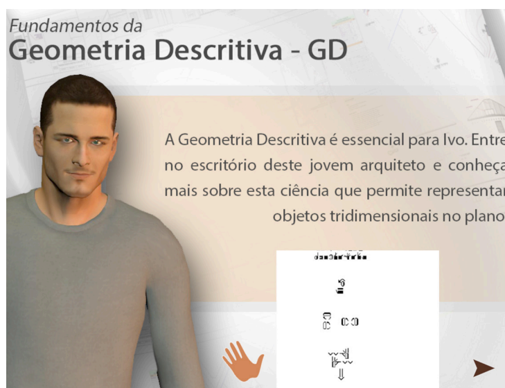
Figura 2: Tela de abertura – opção em SW.