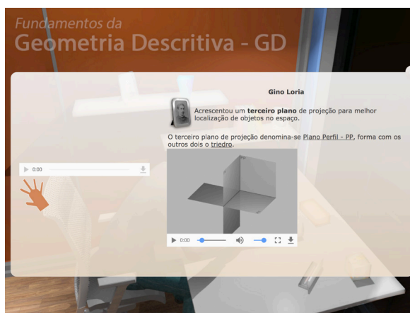
Figura 7: Tela de conteúdo – terceiro plano.

De acordo com Warpechowski [2005] a granularidade está atrelada ao tamanho do OA, sendo que “[...] quanto maior o objeto, mais difícil a sua reutilização; porém, não existe também uma definição clara do tamanho de um objeto de aprendizagem” [WARPECHOWSKI, 2005, p. 16]. A dificuldade de reuso de um objeto maior se deve ao problema de se conseguir contextualizá-lo em uma nova situação.