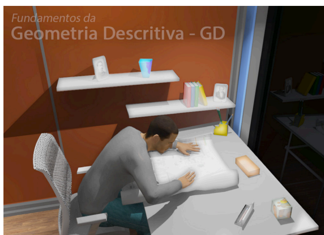
Figura 4: Tela inicial – brilho nos links.

teúdo, conforme é visto na Figura 4. Este acesso pode ser realizado de maneira não linear pelos usuários do ambiente virtual.