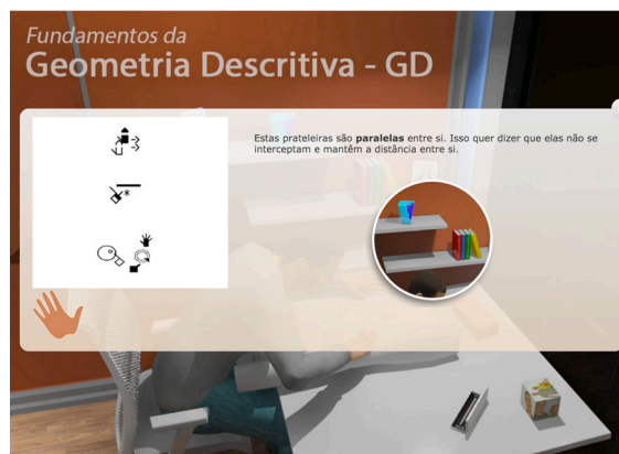
Figura 6: Tela de conteúdo - faces. Fonte: www.cognitivabrasil.com.br/moobi/mariana/office.php