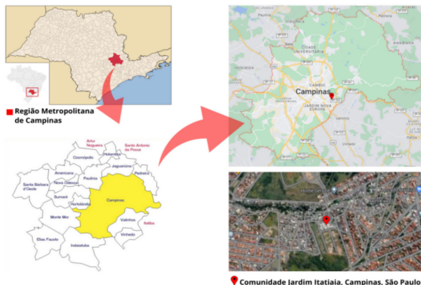
Figura 3 - Mapa da localização da comunidade do Jardim Itatiaia.