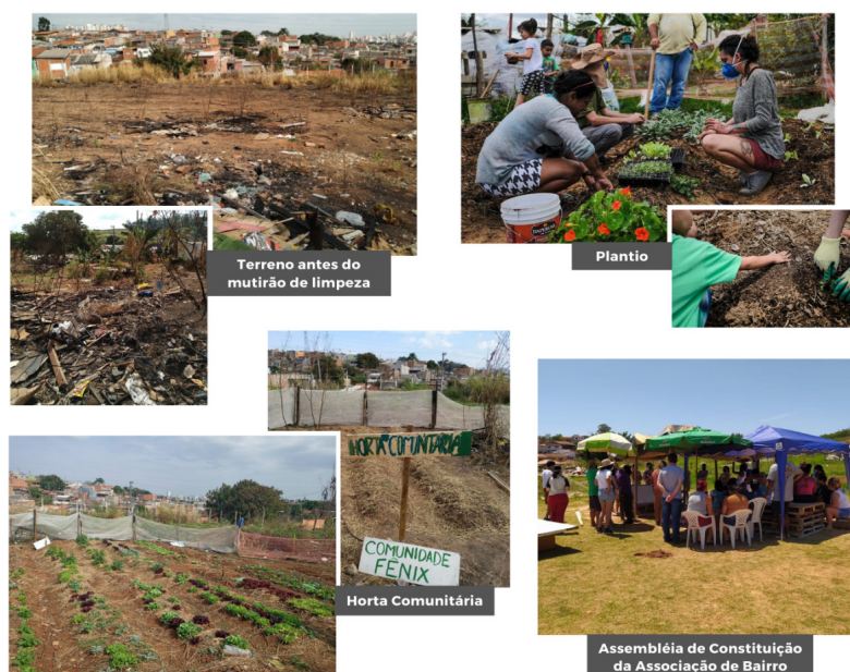
Figura 4 - Fotografias da atuação no Jardim Itatiaia.

“Artigo 2º - O objetivo primordial da Associação é a construção do bem-viver para tudo e todos que habitam o bairro Jd. Itatiaia em Campinas e seus arredores, resolvendo por meio de decisões coletivas e democráticas a tomada de ações comunitárias voltadas para a melhoria da qualidade de vida dos associados.” (arquivo MBV, negrito nosso).