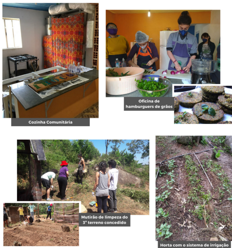
Figura 2 - Fotografias da atuação no Jardim Paraná.