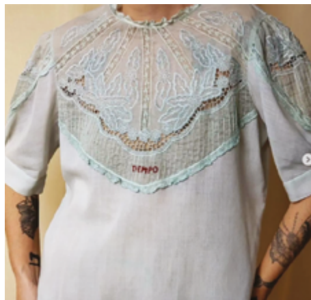
Figura 2 Palavra bordada em blusa de algodão.

As peças bordadas geralmente são camisas em linho ou algodão, masculinas ou femininas, que são tingidas com pigmentos naturais, quando necessário, para encobrir manchas ou revigorar a cor. Algumas possuem pregas, rendas ou bordados antigos. Outras, podem ou não ter bolsos e quase sempre possuem abotoamentos. O bordado pode aparecer também como textura para fortalecer o tecido esgarçado, como ensina a milenar cultura japonesa (Grupo, 2023), ou como um pequeno coração feito com ponto cheio para encobrir alguma mancha ou furo no tecido (Poppi, 2023c). Todos os reparos envolvem um diálogo com o modelo e seus detalhes para que a peça possa durar, como pode ser visto nas Figuras 2 e 3.