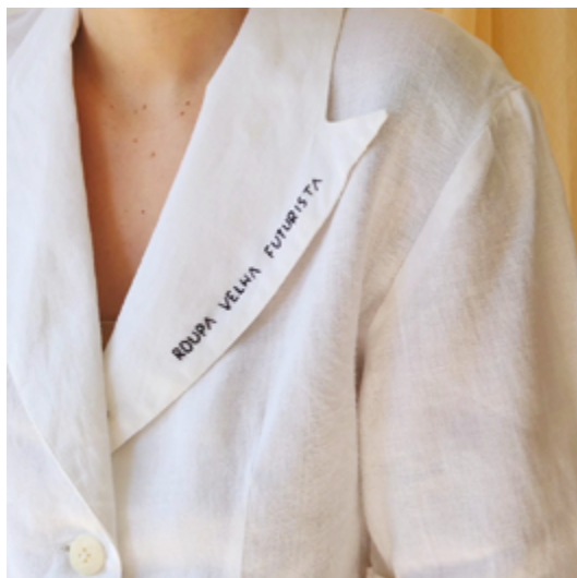
Figura 1 Bordado sobre camisa de linho.