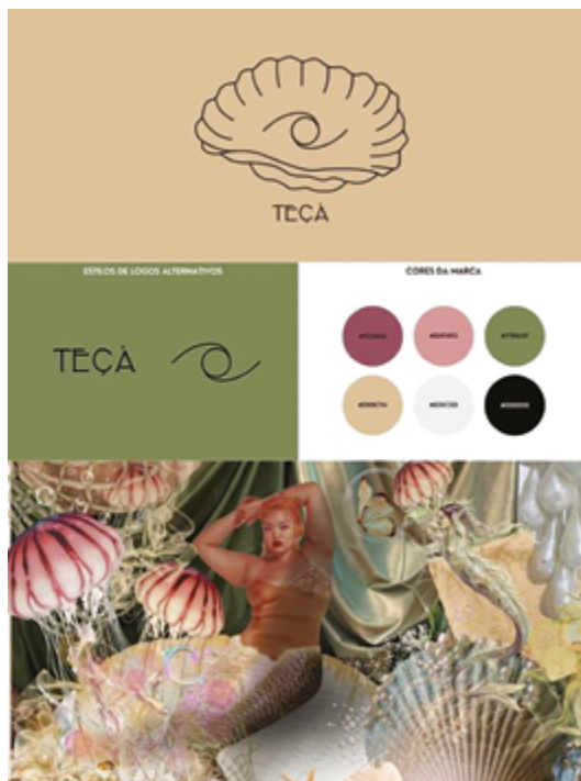
Figura 1 Logo e identidade visual da Teça.