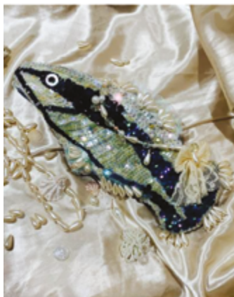
Figura 5 Bolsa Bodião.