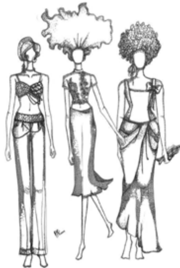
Figura 3 Esboço da coleção.

A coleção cápsula O canto da sereia buscou sua coerência em uma paleta de cor mais sóbria, brincando com tons de verde musgo desbotados, como se fossem fotografados de dentro de um lago, cetim perolado, jeans com lavagem desgastada, transparência e bordados com pérolas, lantejoulas e paetê. E para além das cores, o aspecto vintage se sobressai por meio de silhuetas que realçam e valorizam as curvas, com modelagens características para esse propósito, a exemplo do corset. Calcula-se que o tempo utilizado no processo de bordado das peças foi somado em torno de 200 horas. O release da coleção pode ser conferido nas Figuras 3, 4, 5 e 6: