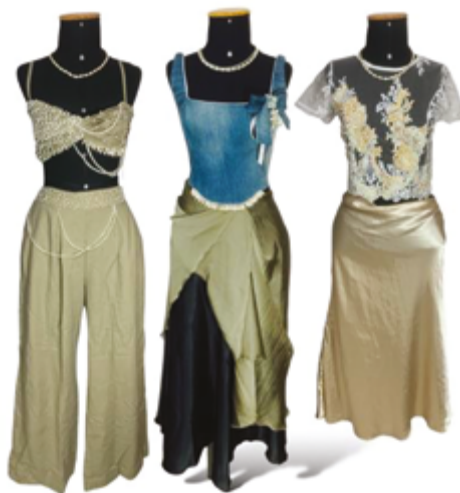
Figura 6 O canto da sereia.