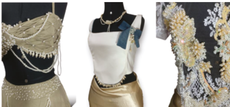
Figura 4 Detalhes em foco.