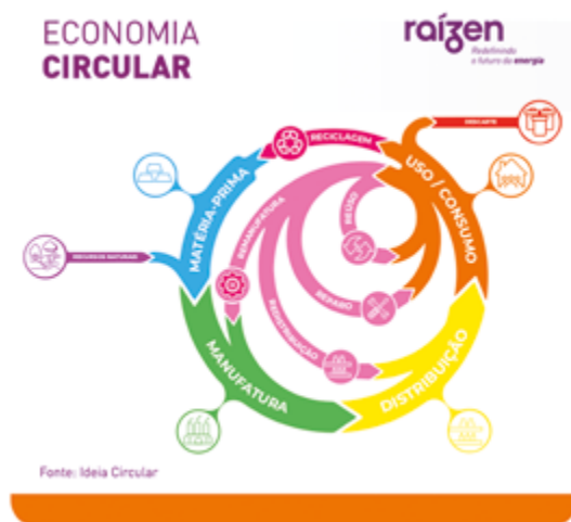
Figura 2 Ciclo de estratégia da economia circular.

A economia circular se define pela transformação dos padrões de produção e crescimento econômicos, vistos como sistemas lineares - caracterizados pela sequência extração-produção-consumo-descarte. Esse processo visa evitar o descarte exacerbado e a poluição, garantindo a gestão estratégica de todo o ciclo de vida dos produtos (Bilitewski, 2012; Buchmann-Duck e Beazley, 2020; H. Wang et al., 2020). A Figura 2, a seguir, apresenta o ciclo de produção conforme a economia circular.