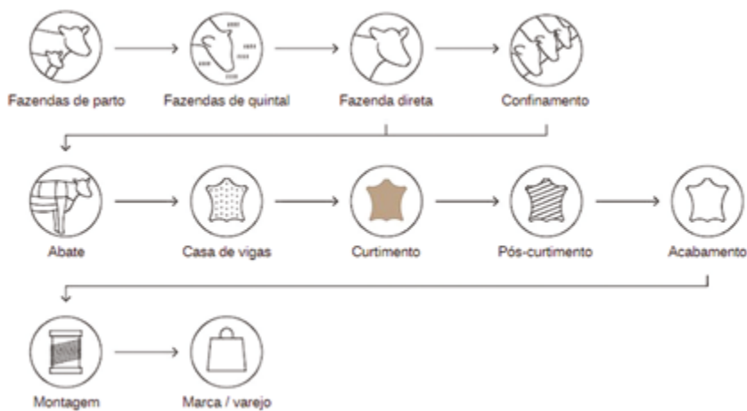
Figura 1 Cadeia de desenvolvimento do couro.

Ilustrado por Inma Hortas, 2022. Traduzida pela autora (2024).