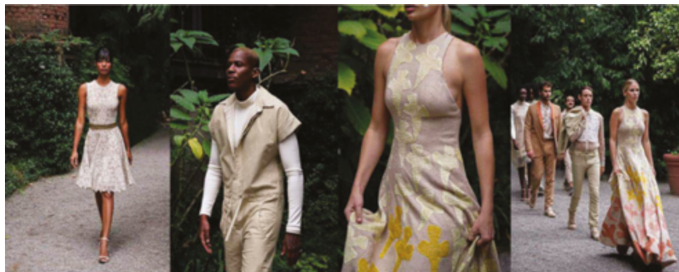
Figura 1 Coleção para Milão Fashion Week 2021.