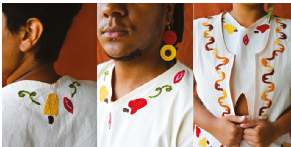
Figura 6 Imagens das peças desenvolvidas.

Após a organização dos desenhos, iniciou-se a elaboração dos moldes das peças superiores, com base nas orientações do curso técnico de moda do IFRJ. Os mockups foram fabricados em algodão cru para ajustes de caimento e conforto e aqui se faz necessário reforçar, que embora os autores tenham buscado ter acesso ao algodão orgânico, não foi possível a tempo de apresentar as peças na defesa final. Todas as peças foram experimentadas por quatro pessoas resultando em ajustes nos moldes para maior conforto. As peças inferiores, como pantalonas e bermuda, foram adaptadas a partir de uma base de calça com cós de elástico para maior adaptabilidade. Os bolsos em formato de coração foram incorporados, e ajustes adicionais no elástico do cós foram feitos para facilitar o vestir. Após a modelagem, os motivos estudados foram organizados e bordados no modelo de apresentação em algodão cru, material mais aproximado do real (Figuras 6 e 7).