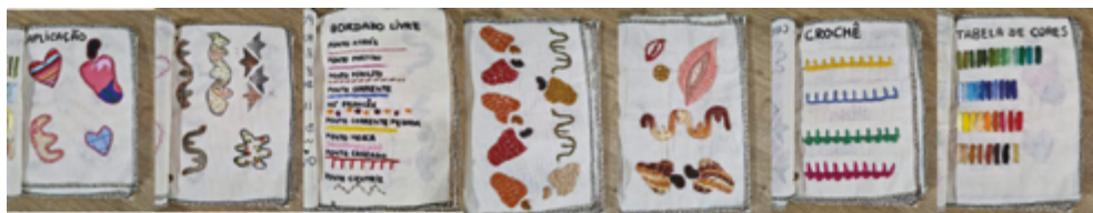
Figura 5 Estudo experimental de estamparia no caderno de tecido.