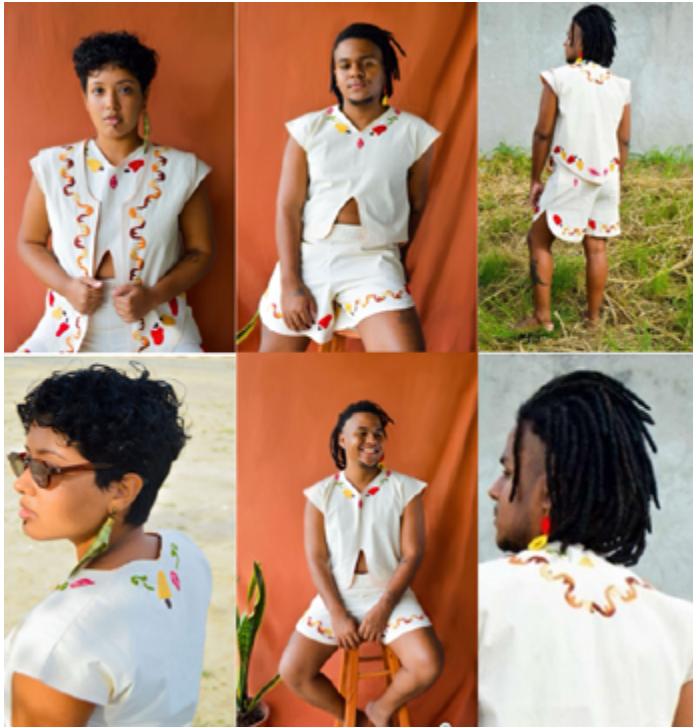
Figura 7 Imagens das peças desenvolvidas.