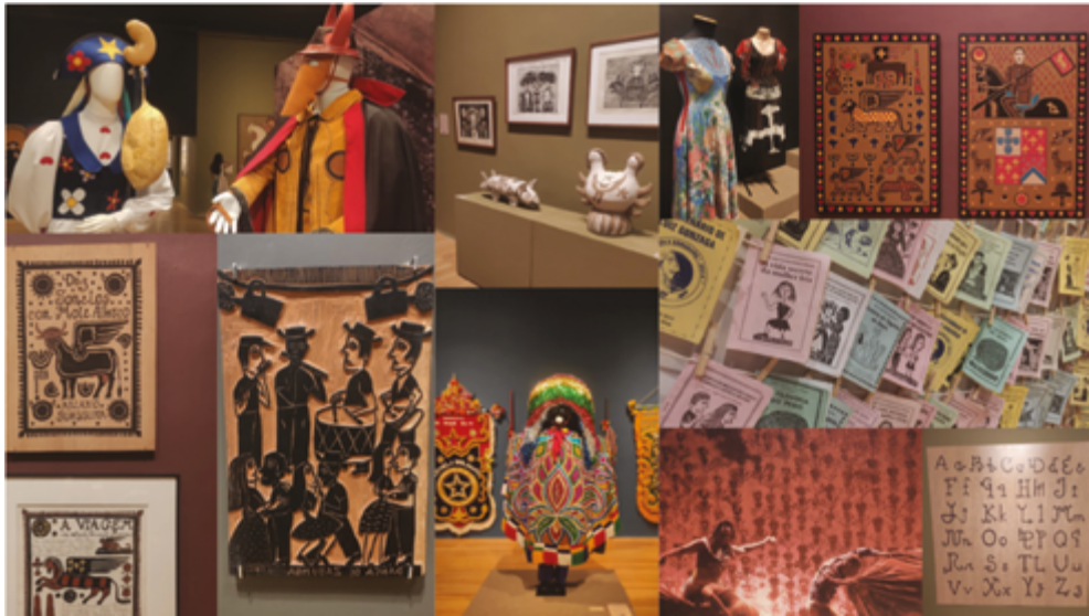
Figura 2 Exposição 50 Anos do Movimento Armorial e Iluminogravura “A Mulher e o Reino”.

Nas artes plásticas, Suassuna se inspirou nas Iluminuras medievais. Estas, na era medieval, eram realizadas à mão em livros para adornar e ressaltar informações, e para isso se utilizavam cores vermelhas, motivos florais e geométricos e às vezes possuíam até detalhes de prata ou ouro que proporcionavam iluminação para a página. A Figura 2 ilustra algumas imagens da exposição realizada no CCBB RJ no ano de 2023, reunindo obras de figurino e indumentária, xilogravura, cordel e iluminogravuras (canto superior direito).