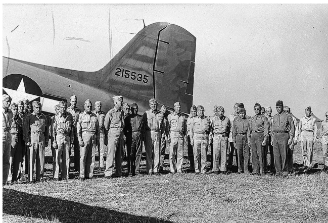
Figura 6.2 – Aviadores da Força Expedicionária Brasileira (FEB) na Itália.