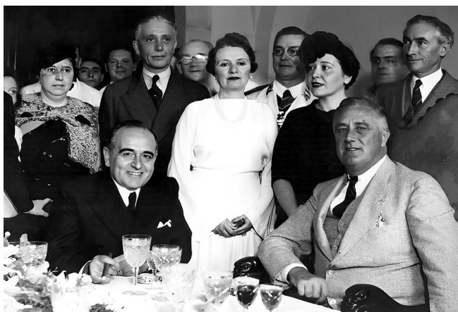
Figura 6.3 – Getúlio Vargas (sentado à esquerda) e o presidente americano Franklin Delano Roosevelt (sentado à direita), Rio de Janeiro, 1936.