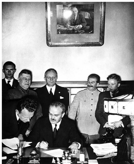
Figura 1.2 – Vyacheslav Molotov, ministro das Relações Exteriores soviético, assina o Pacto Molotov-Ribbentrop.