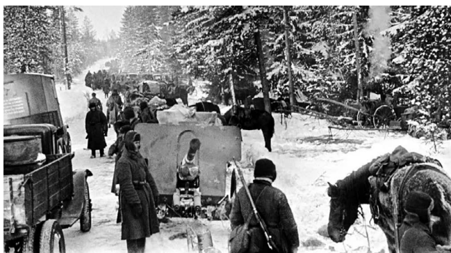
Figura 1.3 – Soldados soviéticos durante a Guerra de Inverno.