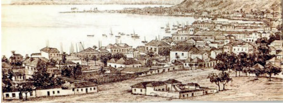
Figura 5.2 – Cidade de Luanda, aquarela.

com homens armados, dispostos a fazer a guerra ao Ndongo, a partir da cidade de Luanda, onde se instalou e mandou construir uma fortaleza.