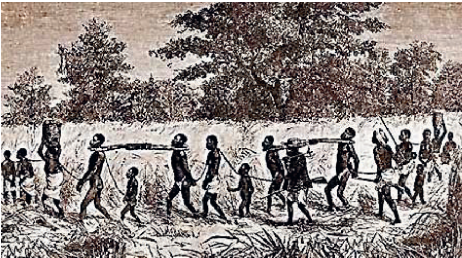
Figura 5.3 – Escravos “cangados”.

Diante deste quadro, Nzinga Mbandi, visando estabelecer a tranquilidade entre as partes, enviou para a cidade de Luanda uma comitiva a fim de contatarem o então Governador, solicitando para que integrassem as conversações algumas figuras eclesiásticas e políticas, o que facilitou o alcance de seus objetivos. Dessas conversações surgiu o “Tratado de Vassalagem” e a aceitação de uma série de imposições do Governador por parte dos integrantes da comitiva de Nzinga Mbandi. Essas imposições, entre outras, resumiam-se no sentido de a Rainha garantir a abertura de suas terras para que os invasores e caçadores de escravos pudessem circular por elas, com as condições devidas para que tais ações acontecessem sem sobressalto.