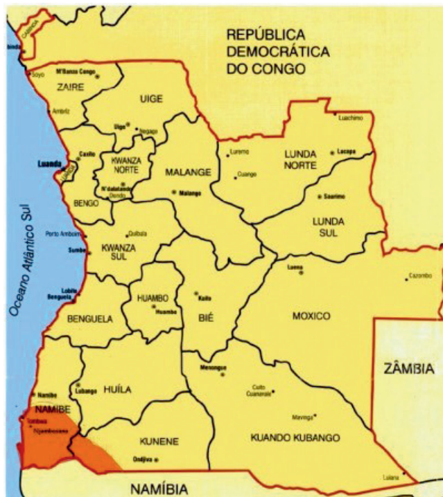
Figura 5.1 – Mapa de Angola.