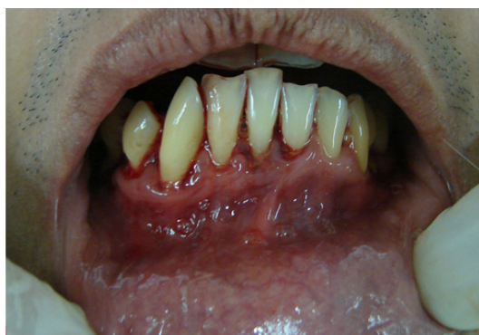
Figura 25.4 – Periodontite crônica generalizada: perda de inserção da gengiva, com exposição radicular, sangramento espontâneo, halitose e mobilidade dos elementos dentários. Note-se que apenas o tracionamento labial já causou