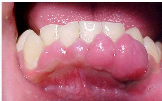
Figura 25.3 – Hiperplasia gengival associada a biofilme dental: cobertura de gengiva hiperplásica, sangrante ao toque, o que denuncia processo inflamatório subjacente. Note-se a presença de matéria alba (biofilme + restos alimentares) na cervical do canino direito, e presença generalizada de biofilme nas superfícies dentárias.