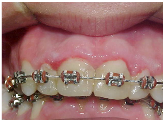
Figura 25.2 – Gengivite marginal: área eritematosa no contorno parabolóide gengival superior. Note-se o acúmulo de matéria alba (biofilme + restos alimentares) provavelmente devido a dificuldades de higienização em virtude de aparelho ortodôntico.