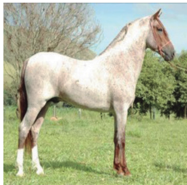
Figura 19. Égua rosilha. 19

Temos ainda os bois e as vacas, que poderiam ser utilizados na alimentação e na tração dos carros de bois. Do mesmo modo que são caracterizados os equinos, os bois e vacas também possuem distinções entre si, que interferem no seu valor e na sua funcionalidade. Há, por exemplo, a descrição de boi com frieira e boi normal; de vacas paridas, com crias e solteiras (que, até aquele momento, não estariam prenhas ou teriam um animal novo). O marroaz, um tipo de boi, era utilizado especialmente para a recria.