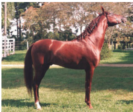
Figura 16. Égua queimada. 16