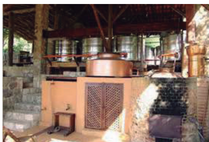
Figura 5. Alambique. 5

O alambique de cobre (Figura 5) é um recipiente onde se recolhe a matéria-prima utilizada para destilação, que atravessa uma tubulação conduzindo vapores e um condensador que a transforma em líquido por meio de seu resfriamento. A matéria final seria a aguardente.