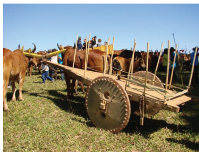
Figura 3. Carro de boi. 3

O carro de boi é um desses instrumentos, responsável por todo e qualquer transporte, seja de pessoas ou cargas. De acordo com Souza (2003), no século XIX, o carro de boi foi de imensa importância para o transporte pesado em terra, pois garantia a importação e exportação de mercadorias entre os estados e dessa forma ajudava a garantir a expansão econômica do país. Essa assertiva, sobre quão meritório era esse bem a época, se ratifica ainda mais com a ocorrência dele em todos os autos em análise e com a observação do preço que era atribuído ao bem em comparação ao outro, como por exemplo, no processo de 1880, “Um carro, avaliado, por oitenta | <80$000> mil reis”, enquanto que, “Uma <3$000> | caixa grande, por trez mil reis”, ou um “Um cavallo queimado, por vinte | <20$000> mil reis, á margem”. O carro de boi só não era mais caro do que um escravo.