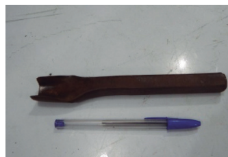
Figura 11. Goiva. 11