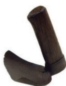
Figura 10. Enxó. 10