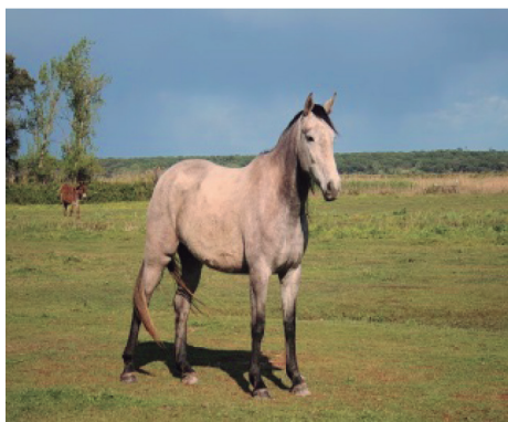
Figura 18. Cavalo russo. 18