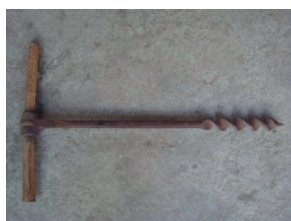
Figura 9. Trado. 9

Para se confeccionar o almofariz eram necessários ainda o trado (Figura 9), tipo de verruma utilizado para confeccionar furos largos na madeira de grande espessura, o enxó (Figura 10) e a goiva (Figura 11), utensílios utilizados na feitura dos contornos de uma peça de madeira, dando-lhe o acabamento desejado. Esses três instrumentos tiveram ocorrências nos quatro processos analisados.