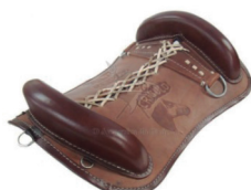
Figura 4. Basto. 4

Foi inventariado um basto (Figura 4), peça utilizada na ornamentação da montaria de um animal, de acordo com a definição de Houaiss e Villar (2009); trata-se da parte acolchoada e paralela ao lombilho que se escora no lombo da cavalgada.