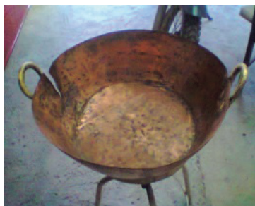
Figura 15. Tacho. 15

Foram inventariadas telhas, matéria-prima para construção residencial, um bem de grande valor na época, visto que os locais de venda dessa peça eram possivelmente de difícil acesso.