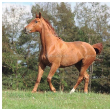
Figura 17. Égua castanha. 17