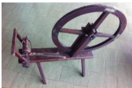
Figura 12. Roda de fiar. 12

A roda de fiar (Figura 12), objeto formado principalmente por uma roda que gira em um eixo, era utilizada para a elaboração das linhas que, por sua vez, seriam tramadas em um tear (Figura 13) e resultariam na produção de tecidos para a confecção de vestimentas e/ou agasalhos, tais como os inventariados nos processos, como o ponche, uma capa confeccionada em lã grossa; a sobrecasaca, um tipo de casaco comprido; e o chapéu de chile, um tipo de sombreiro.