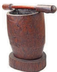
Figura 6. Almofariz. 6

para produção de paçocas, entre várias outras utilidades. Esse instrumento era esculpido na madeira que, por sua vez, era extraída utilizando de um machado (Figura 7, também inventariado nos processos), ferramenta formada por uma cunha cortante encaixada em um cabo de madeira. Outro bem inventariado referente ao trato da madeira é o serrote (Figura 8), tipo pequeno de serra.