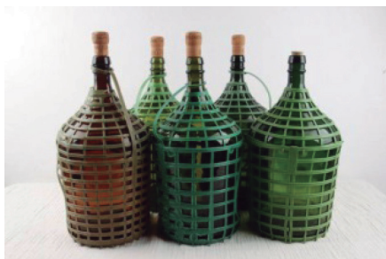
Figura 14. Garrafões. 14

Foram inventariados, também, o tacho (Figura 15), recipiente utilizado para fins culinários, e o garrafão (Figura 14), recipiente utilizado para armazenagem de grandes quantidades de líquido, como a aguardente produzida nos alambiques.