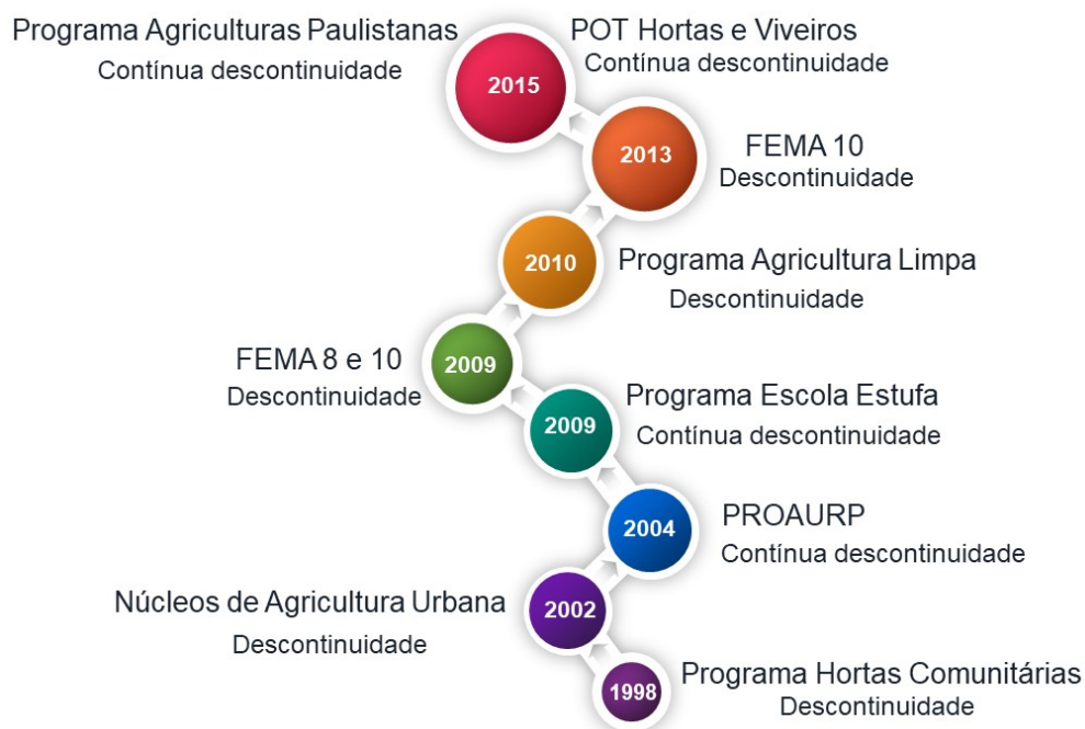
Figura 6.3 – Descontinuidades e contínuas descontinuidades dos programas públicos.

Dos programas e projetos criados no âmbito da agricultura entre 1998 até 2016, identificamos que maior parte foram descontinuados ao longo dos anos, enquanto outros sofrem contínuas descontinuidades políticas e administrativas, conforme representado na figura que segue: