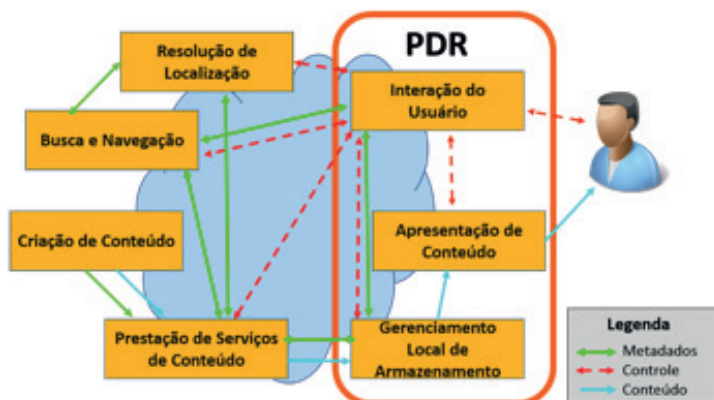
Figura 01: Modelo Funcional de referência do TV-Anytime.