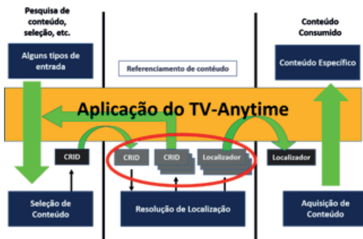
Figura 3: Mecanismo de Referência - CRID

Deste modo, por intermédio do CRID, mais precisamente por meio do “ Location resolving ”, é possível recuperar o endereço de acesso no formato de “ locator ” (localizador).