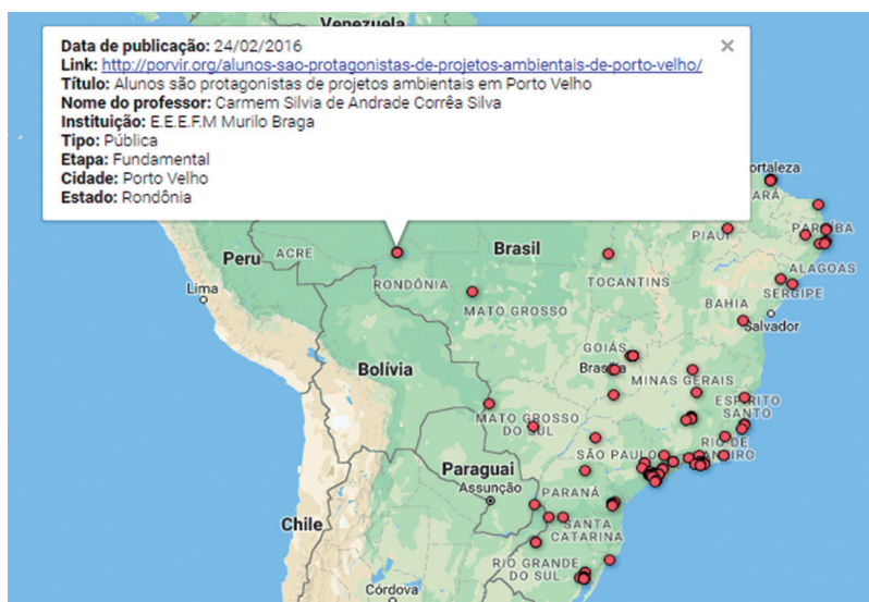
Figura 2 Mapa de professores Diário de Inovações, 2018.