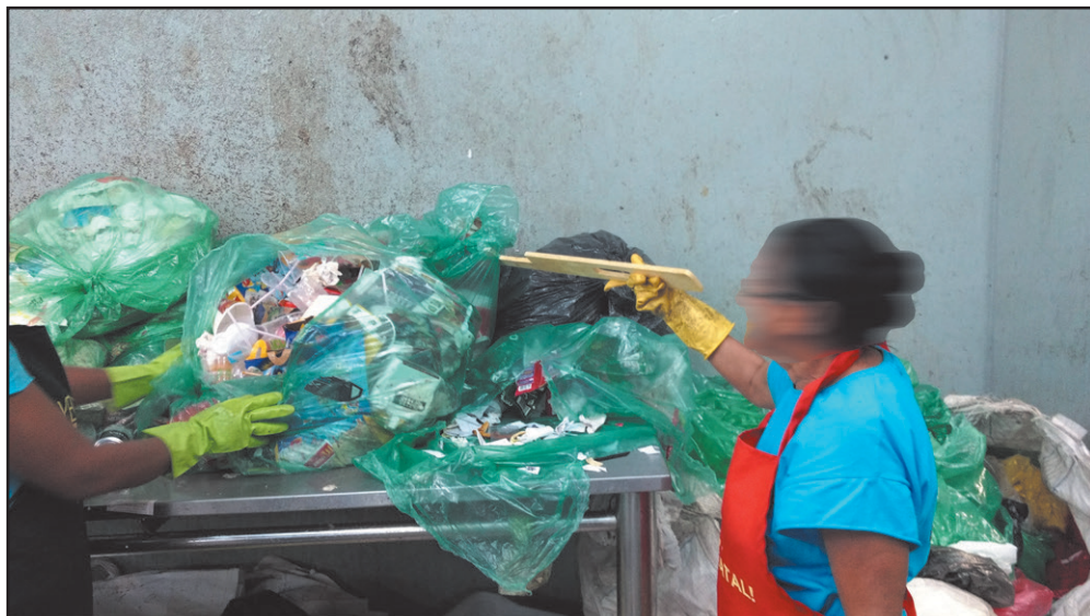
Figura 8.1 - Segundo protótipo da Régua Longa de Proteção (REL P)