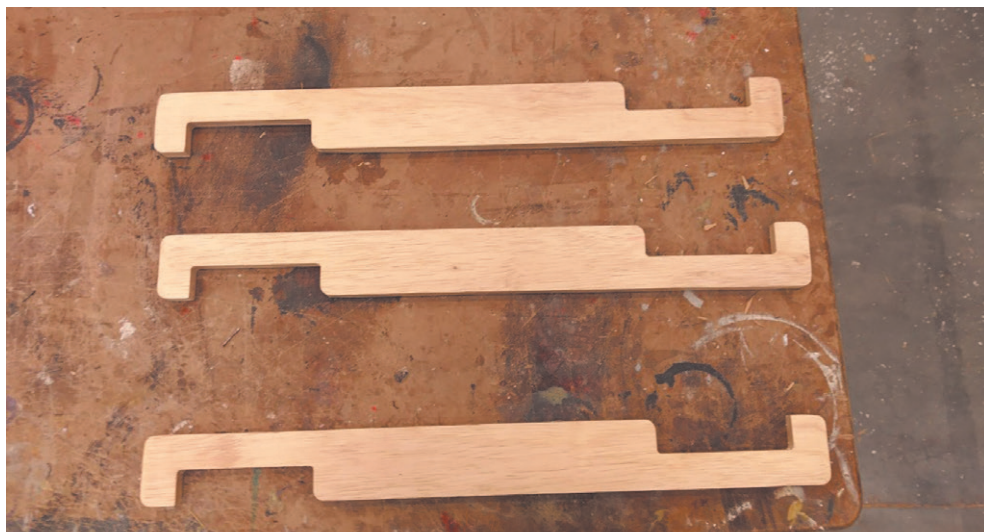
Figura 8.4 - Protótipo da Régua Longa de Proteção (RELP)