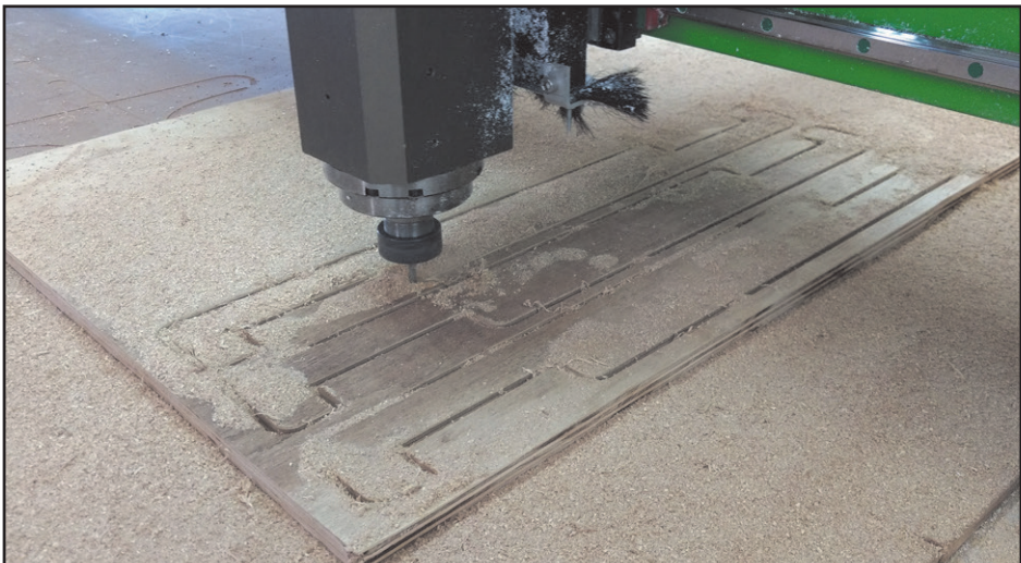
Figura 8.3 - Fabricação da quarta Régua Longa de Proteção (RELP) na Router CNC