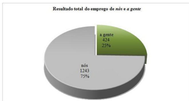
Gráfico 13.2 – Distribuição do uso de nós e a gente em nossa amostra